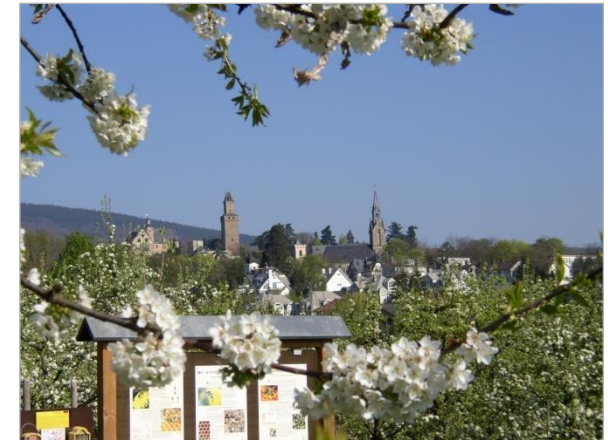
Blick von der Erlebnisobstwiese auf die Burg Kronberg