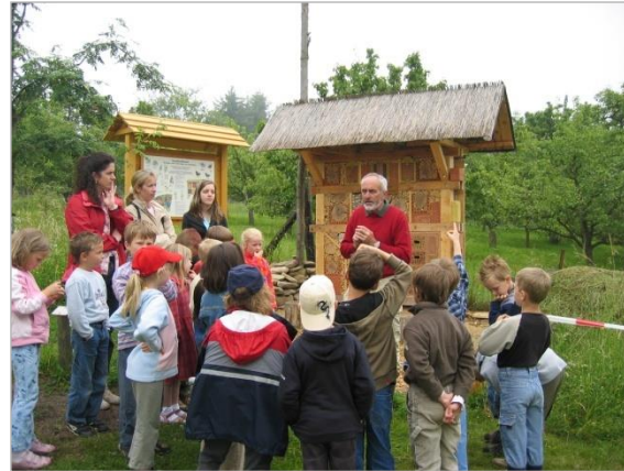
Kindergruppe auf der Erlebnisobstwiese

Um der jüngsten Generation und deren Eltern die Bedeutung des Obstbaues anschaulich und praktisch näher zubringen, wurde im Jahr 2001 die Erlebnisobstwiese (EOW) konzipiert und angelegt. Hier wird an 13 interaktiven Stationen Natur zum Anfassen angeboten.